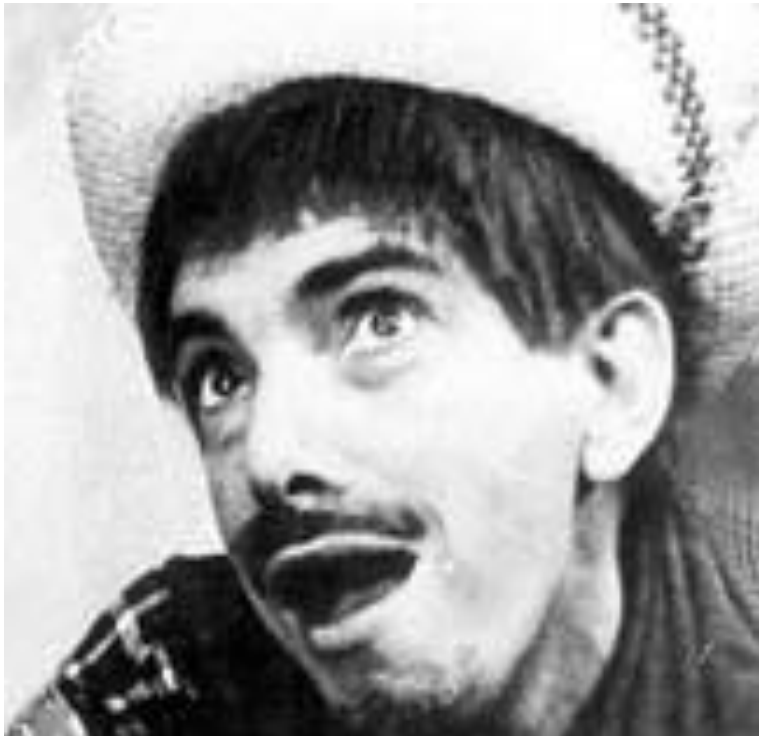
Mazzaropi e o cinema brasileiro.