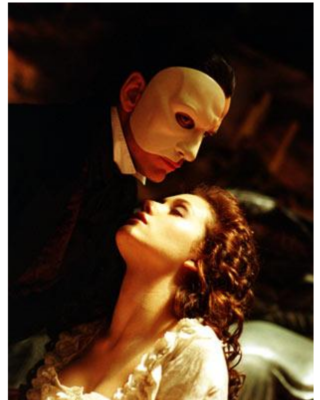
O fantasma da ópera

Ligada ao meio acadêmico e científico. Realizada por uma minoria que fazem parte da elite.