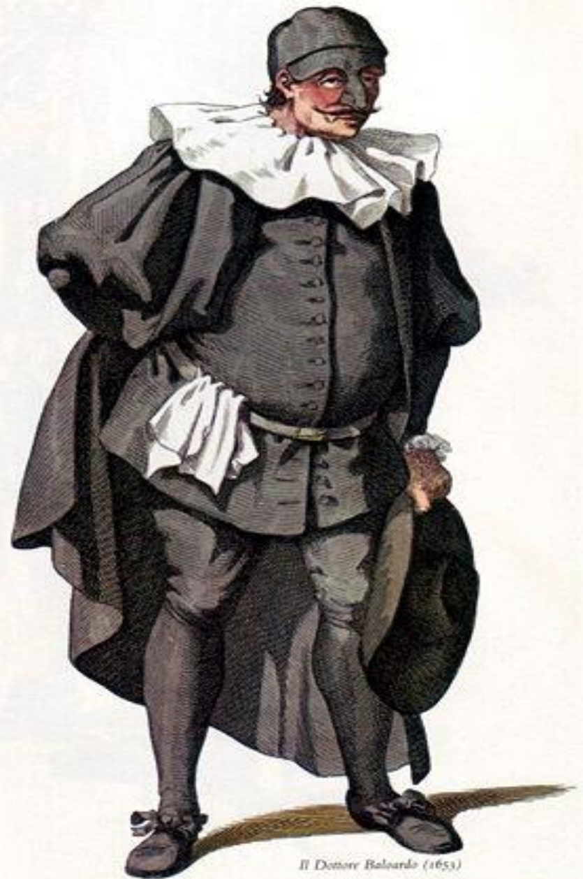
Il Dottore Balardo (1653)